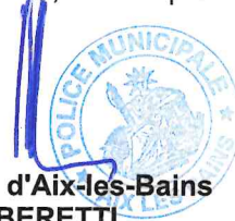
Le Maire d'Aix-les-Bains Renaud BERETTI